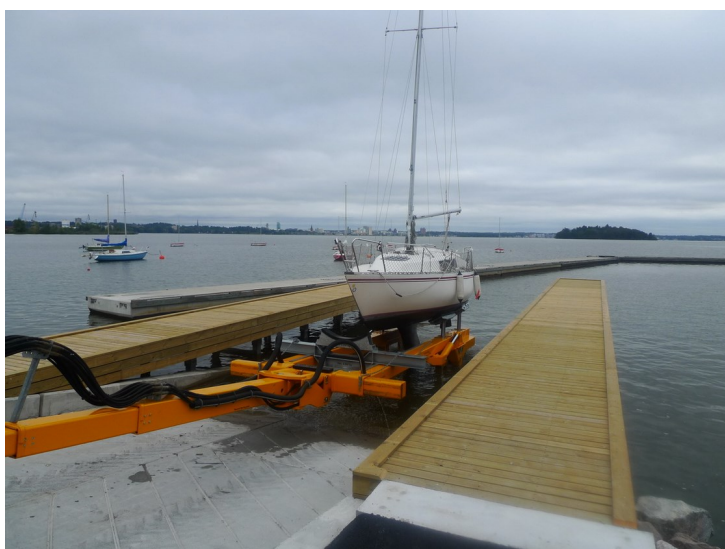
Bild från nya upptagningsvagnen